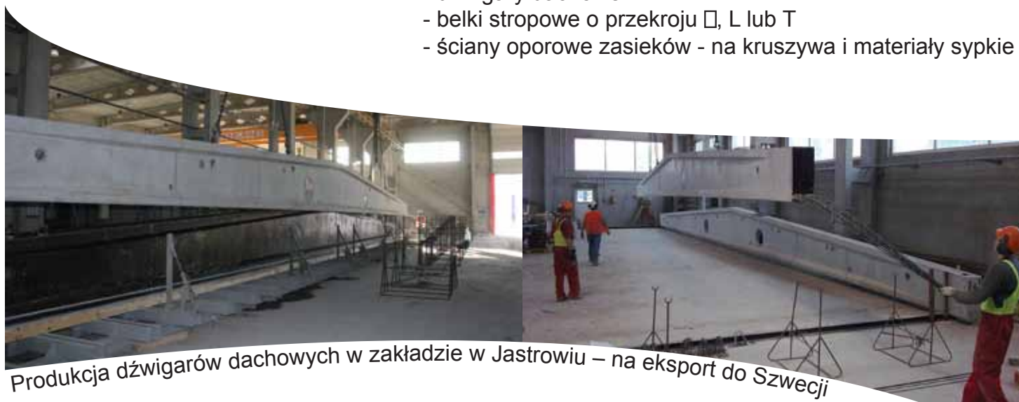
Produkcja dźwigarów dachowych w zakładzie w Jastrowiu – na eksport do Szwecji